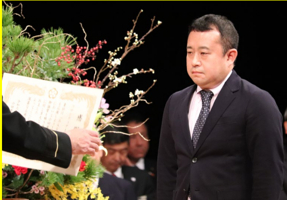
フロンティア1 株式会社