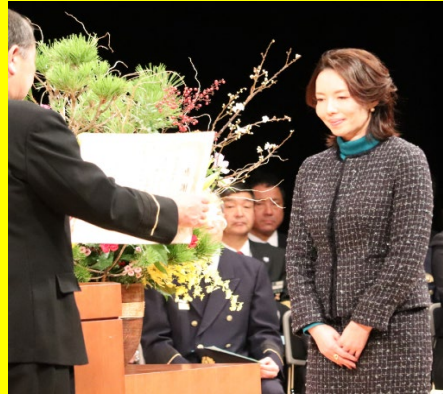
株式会社まるだい運輸倉庫