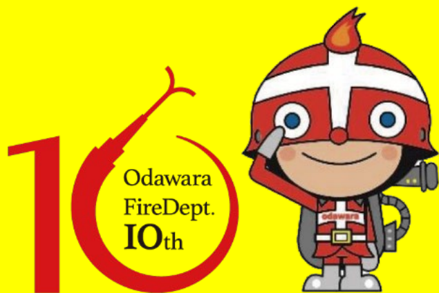
広域消防発足10周年記念ロゴマーク (おだわら、みなみあしがら、なかい、おおい、まつだ、やまきた、かいせい)